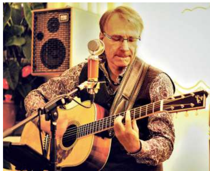
Andreas Thust begleitet das Weinfest auch in diesem Jahr musikalisch.